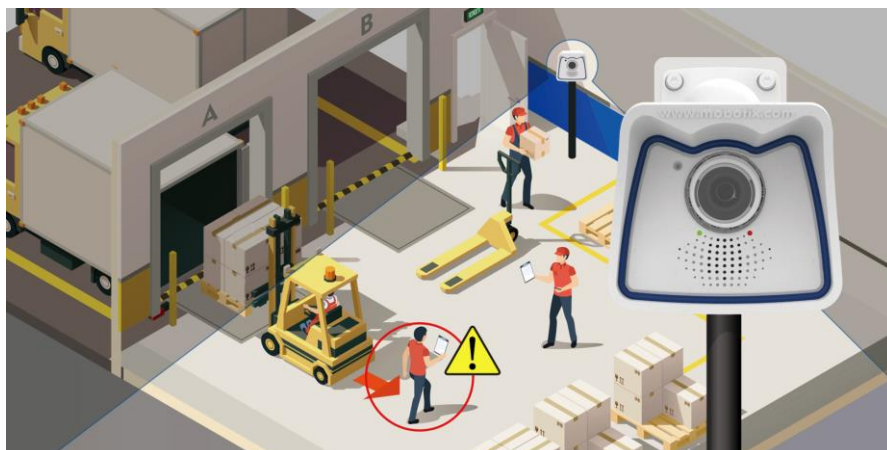
画像IoTを活用したフォークリフト事故低減サービスのイメージ